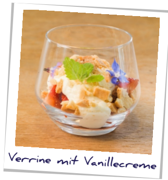
Verrine mit Vanillecreme