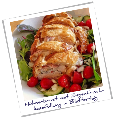
Höhnerbrust mit Ziegenfrisch- kasefüllung in Blätterteig