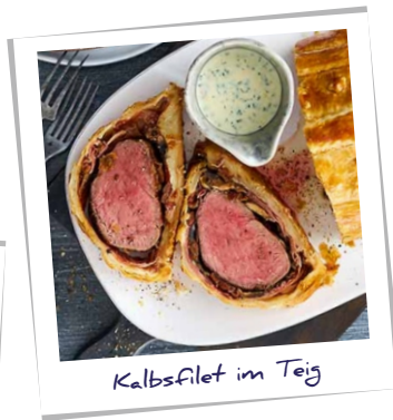
Kalbsfilet im Teig