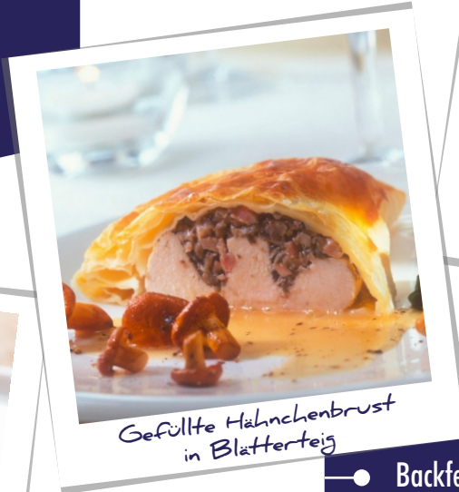
Gefüllte Hähnchenbrust in Blätterteig