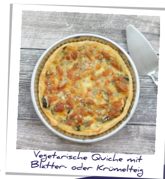
Vegetarische Quiche mit Blätter- oder Krümelteig